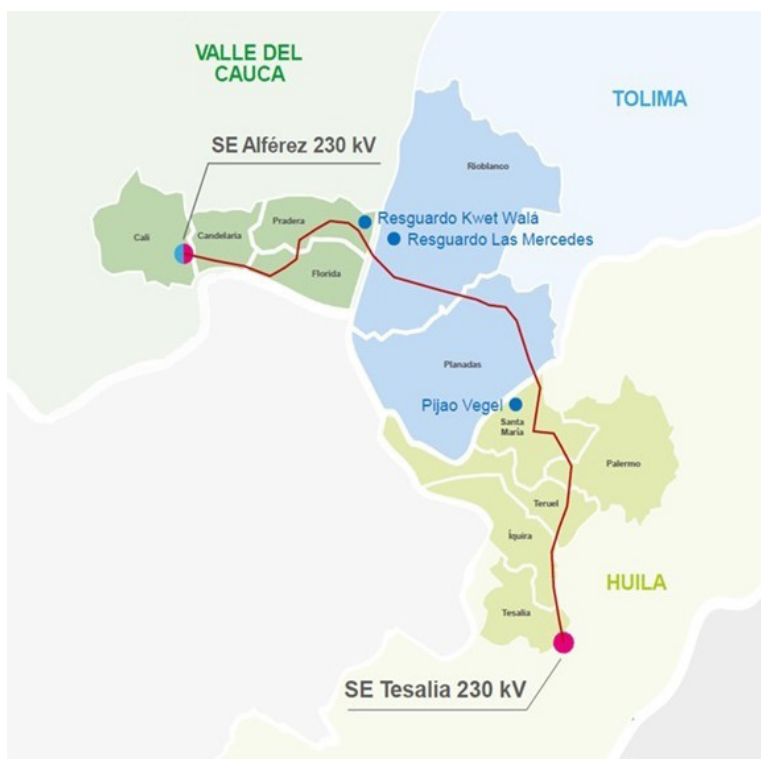
Mapa de Tesalia-Alfárez.

No obstante la importancia del proyecto, su éxito se veía amenazado por la presencia de minas antipersona. Recorriendo más de 200 kilómetros a lo largo de Colombia, la línea de transmisión atravesaba el epicentro del conflicto armado, una zona con alta concentración de minas.