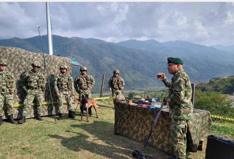
Miembros del Ejército Nacional de Colombia imparten capacitación en seguridad frente a minas antipersona (Planadas, Colombia).